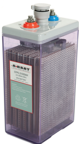
Bilde er av 300Ah modellen